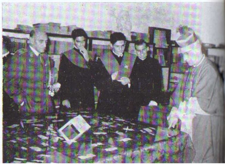
El Sr. Obispo, en la exposición de Numismática.

Acto de la vestición de los nuevos seminaristas del Seminario mayor.