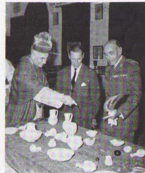
Nuestro Excmo. Sr. Obispo, el Excmo. Sr. Capitán General y el Ilmo. Sr. Presidente de la Diputación en el Museo Bíblico.

De la época de los Patriarcas, hay unas 10 piezas de cerámica, algunas muy bien