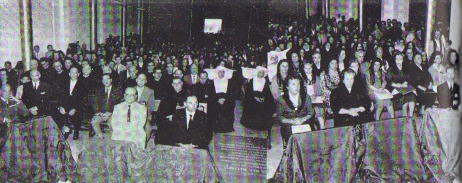
Aspecto de la iglesia el día de la bendición del Sagrario y Cruz del Altar.