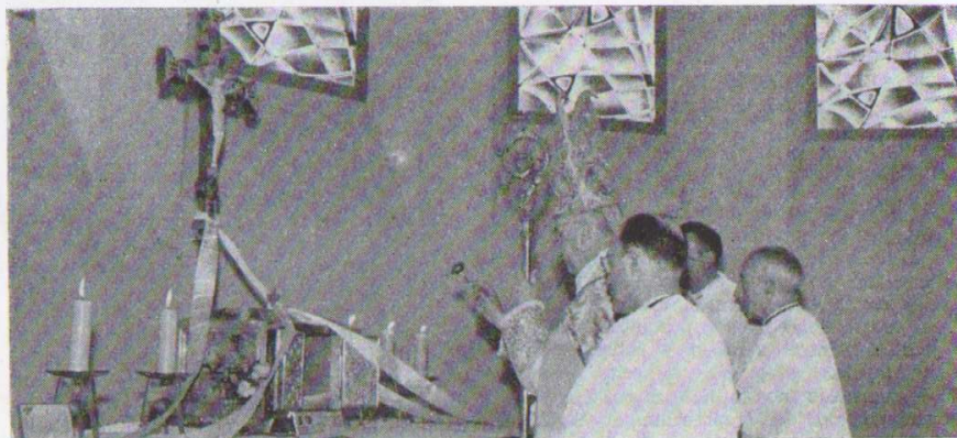
El Sr. Obispo en el momento de la bendición del nuevo Sagrario

Varias circunstancias hicieron que el día de clausura de las solemnidades de la bendición del Sagrario fuera sencillamente impresionante.