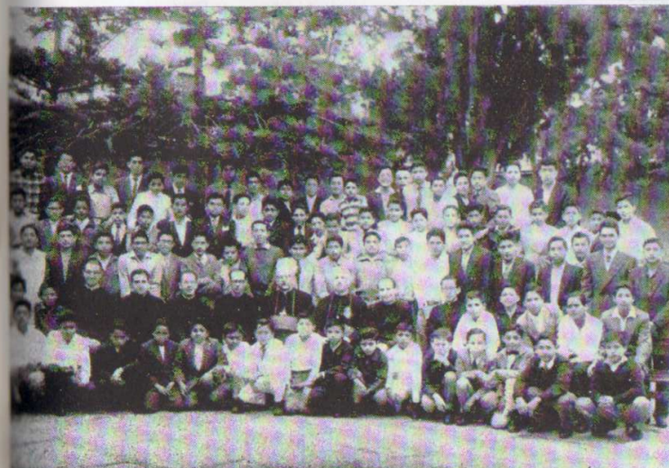
Los seminaristas de Trujillo a los seminaristas de Mallorca